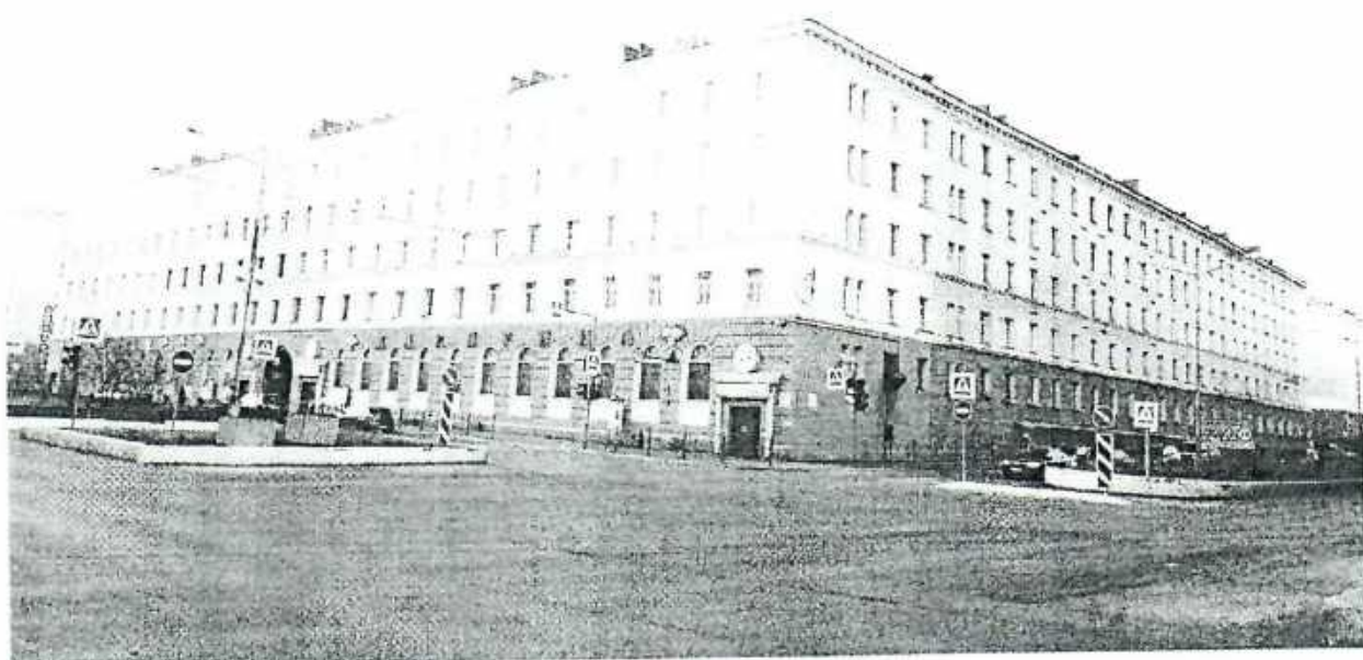
Фото 1. Вид с северо-восточной стороны